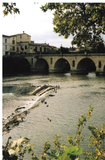
A Sommières Petits canards sur le Vidourle