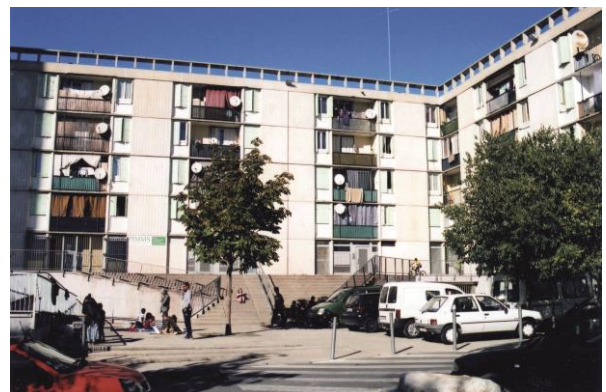
Un quartier animé, Watteau