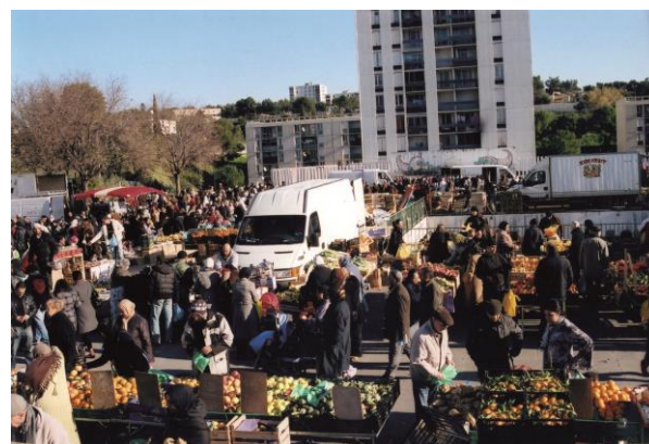
Une vue sur le marché en 2011

Le prix des transports. Variation entre Nîmes-Métropole et le Gard, mai 2018 Sur le Gard, il en coûte aux familles 70€ par an et par enfant, mais pour un enfant résidant sur le territoire de Nîmes Métropole, c'est 190€. Cette situation n'est pas acceptable. Il n'y a pas de contrainte économique, mais un choix politique.