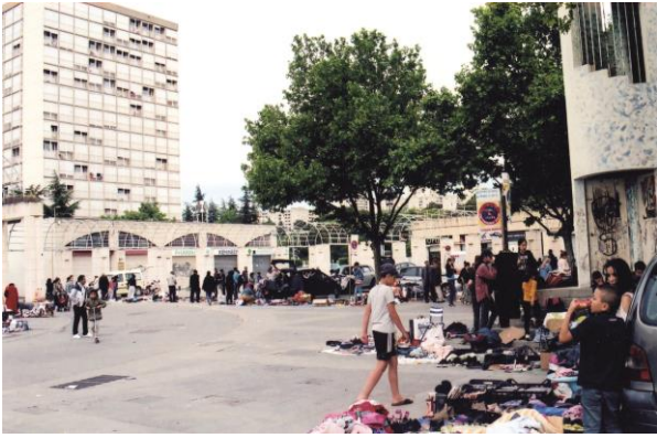
La friperie de Parents animés, en 2017

Elle avait lieu encore cet automne, mais le mauvais temps la fait retarder. Nous parlerons de cette association dans une prochaine publication.