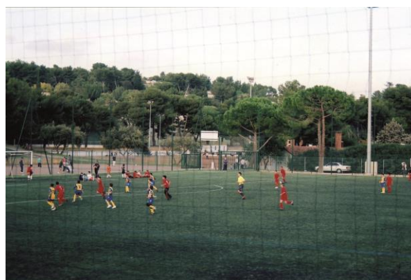
Petits écoliers à Marcel Rouvière