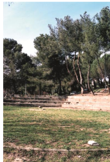
Combe des oiseaux, les petites arènes

La rue Messenger , toute bossue sous les racines de pins, reçoit un traitement. C'est une bonne amélioration pour ce lieu sympathique.