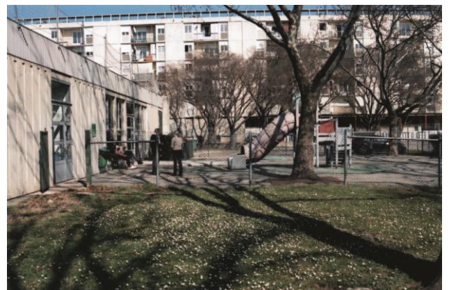
Entre Fragonard et la digue, le coin Vergnole

Dans une école d'ingénieurs, qui sera parrainée par Nîmes-Métropole, on demande 6800 € d'inscription, alors qu'une école mieux cotée, l'école des Mines d'Alès, demande 2150 €.