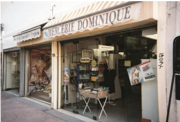
La mercerie, en 2002, photo Jean-Paul

Bar Univers Pub Salon de thé - Terrasse - PMU Place Debussy - Gal R. Wagner