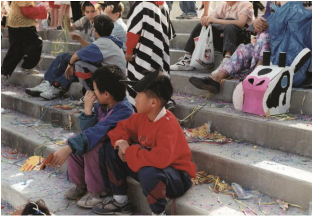
Les enfants, la fête spontanée, en 1993