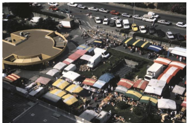
Le marché en 2002

Selon la Mutuelle Ircantec , après 65 ans nous sommes 44 % à être des bénévoles. Cela se voit aux réunions.